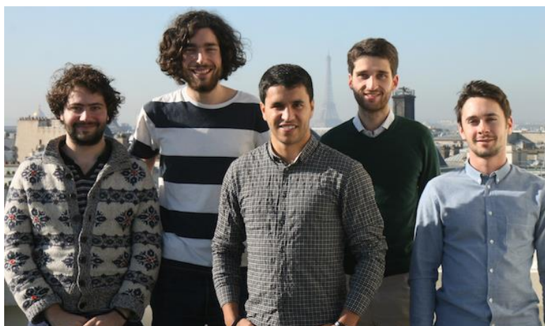
L'équipe de Pricematch

Instent prévoit de lever encore 400 000€ dans le but d'atteindre son objectif de 1,4 million d'euros lui permettant ainsi de mener à bien ses recherches et son développement jusqu'à fin 2016.