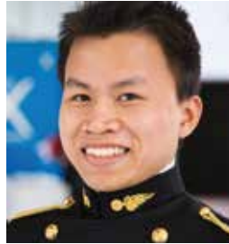
Bach CHU XIAN X 2014

Bourse d'excellence internationale Chuc Huang (X 1964) pour le Viet-Nam