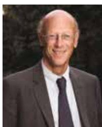
Paris MOURATOGLOU X 1960