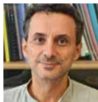
Emmanuel BACRY Big Data pour la santé et l'économie de la santé